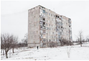
Novhorodske, Ukraine. Février 2020.