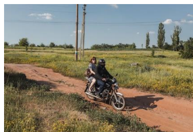
Novhorodske, Ukraine. Juin 2018.