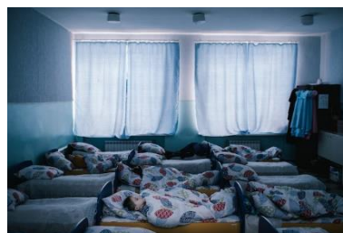
Dans l'école n°14, les plus jeunes élèves font la sieste. Mars 2018.