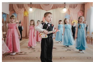
Répétitions du spectacle de l'école n°14 pour la Journée de la femme, le 8 mars. Mars 2018.