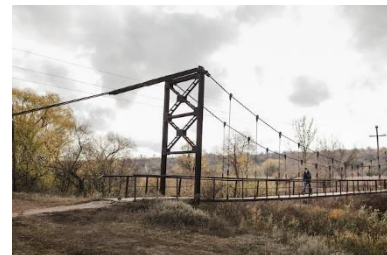
Novhorodske, Ukraine. Novembre 2020.