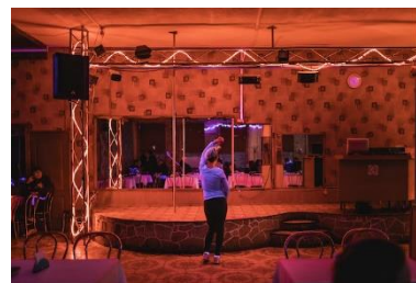
Svitlana danse dans l'unique night-club de la ville. Octobre 2018.