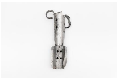
Queue de l'empennage d'une grenade à fragmentation OG-9.