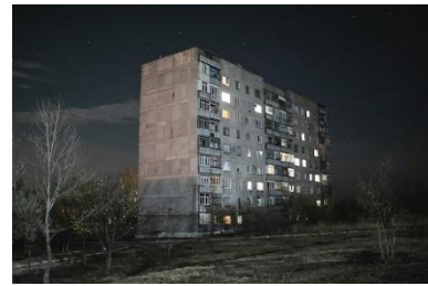
Novhorodske, Ukraine. Novembre 2020.