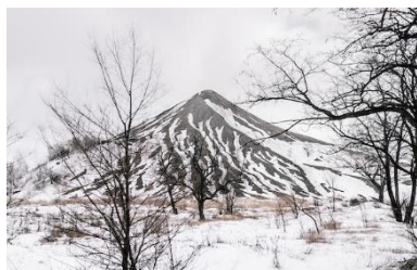
Toretzsk, Ukraine. Mars 2018.