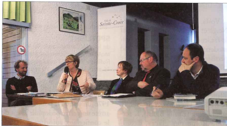
La table « ronde » réunit les porteurs de projets.

Pour l'aire de coopération Mont d'Or - Chasseron, il ressort que les acteurs sont très autonomes et que les projets démarrent dans la plupart des cas sur un coup de coeur,